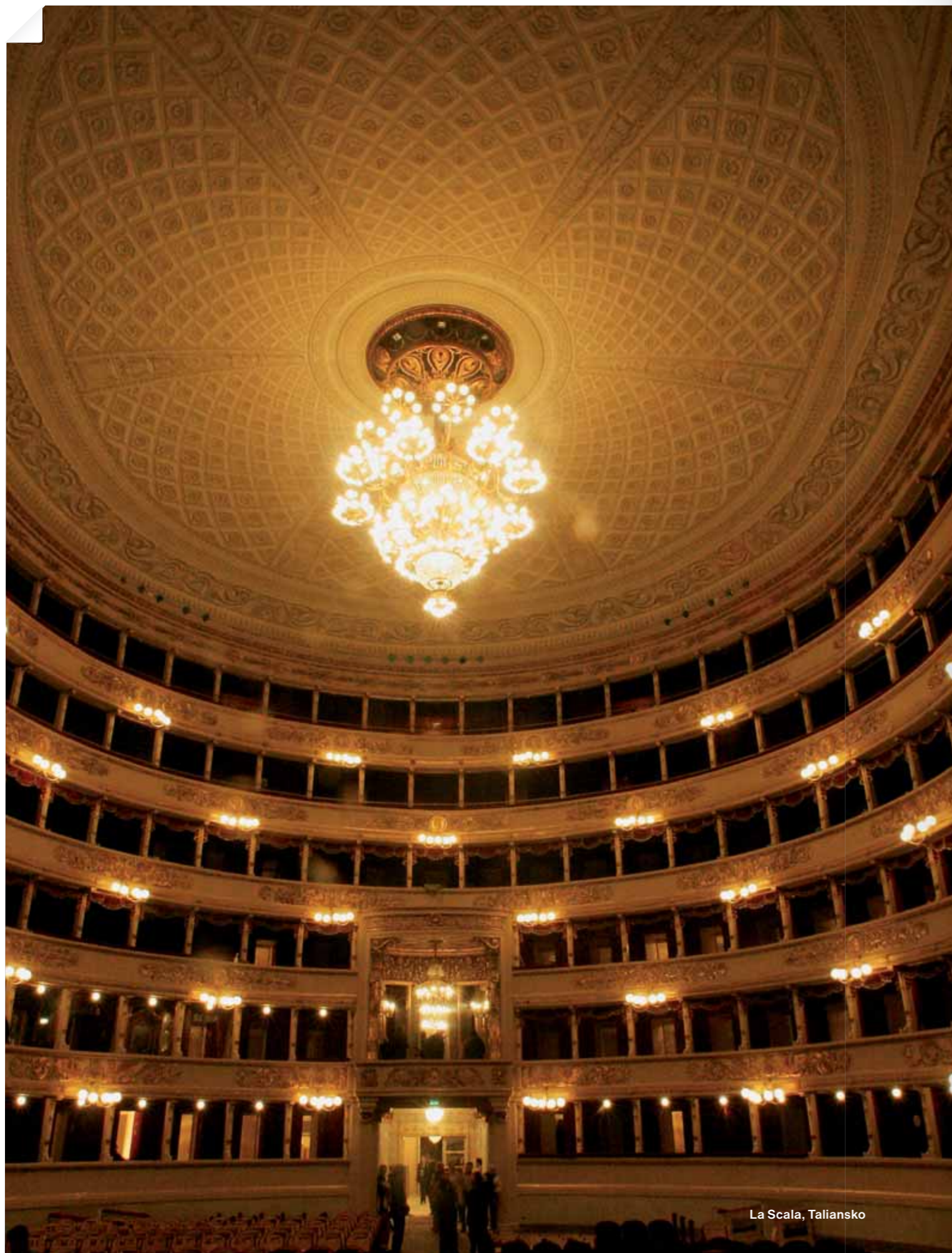
La Scala, Taliansko